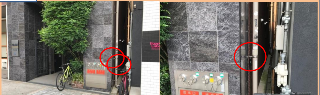
アクアブレイス南堀江 キーボックス 0318 建物右の配管パイプ