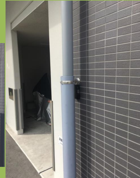
ファーストフィオーレ京都西 陣キーボックス 0318 建物管理会社